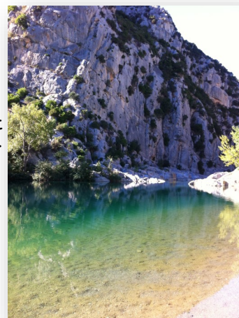
Le Verdoble et ses eaux cristallines, une ressource insuffisante pour les besoins en eau de la commune

Nous vous tiendrons informés de l'évolution de ce dossier courant 2015.