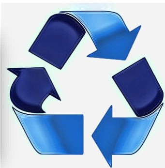
Exemple de ce qui ne sera pas ramassé